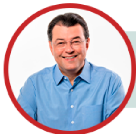
EDUARDO BRAGA (MDB)