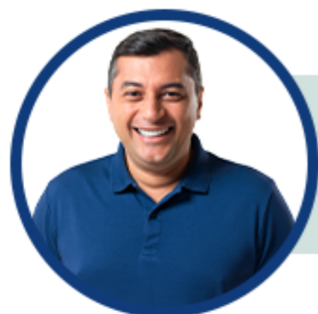
WILSON LIMA (UNIÃO BRASIL)